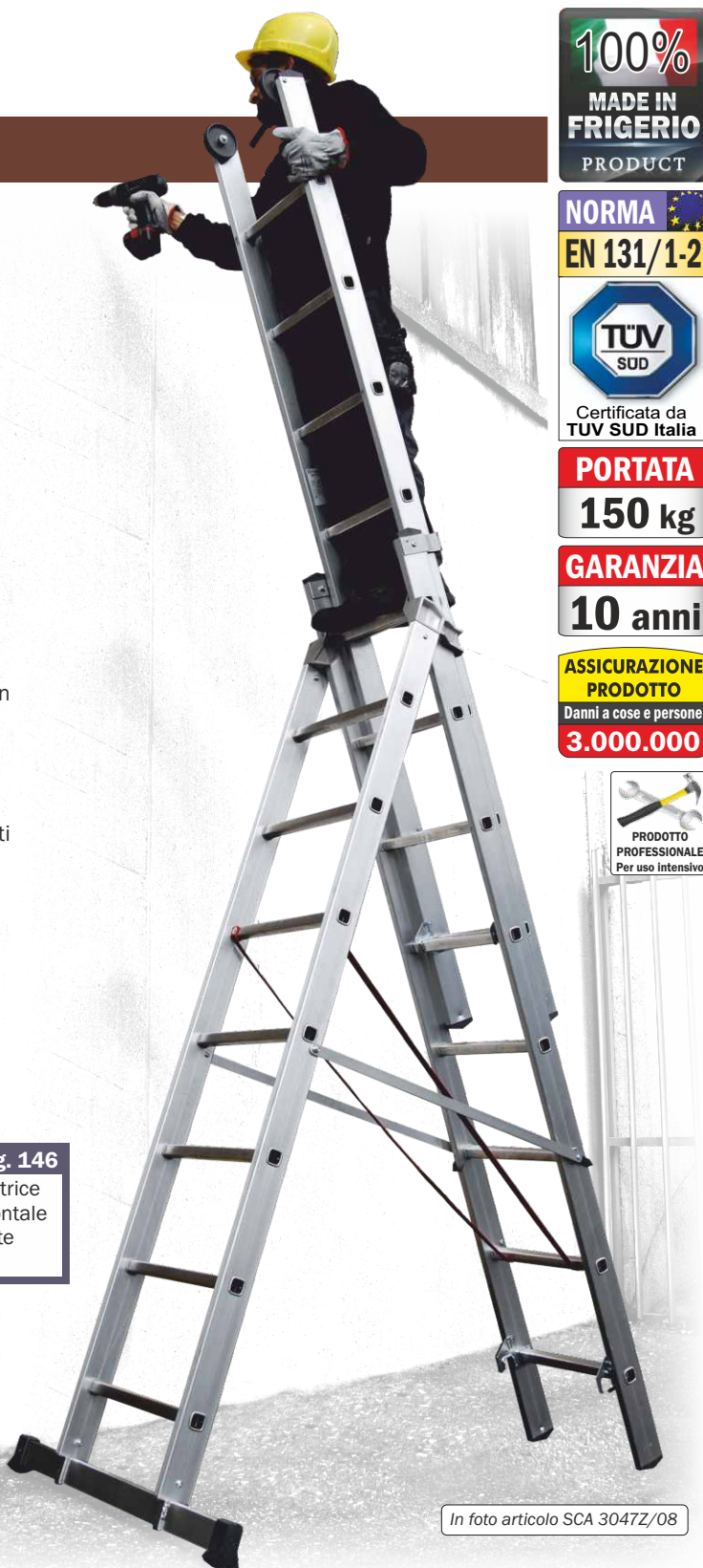
In foto articolo SCA 3047Z/08

sono dotati di dispositivo ad uso «ZOPPO» che consente di compensare pendenze, scalinate o forti dislivelli per poter adattare la scala anche alle condizioni più difficili