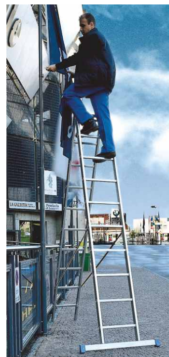
In foto articolo SCA 3045Z/09