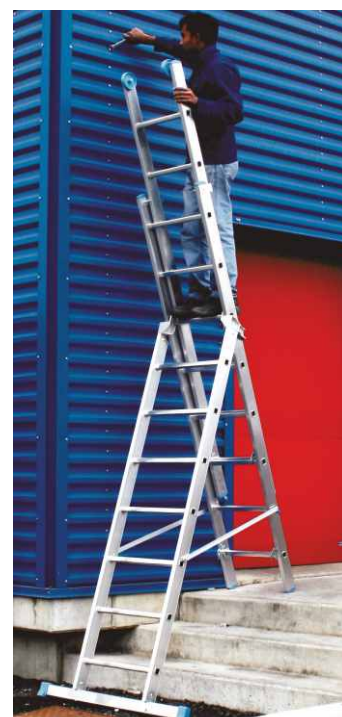
In foto articolo SCA 3047Z/08