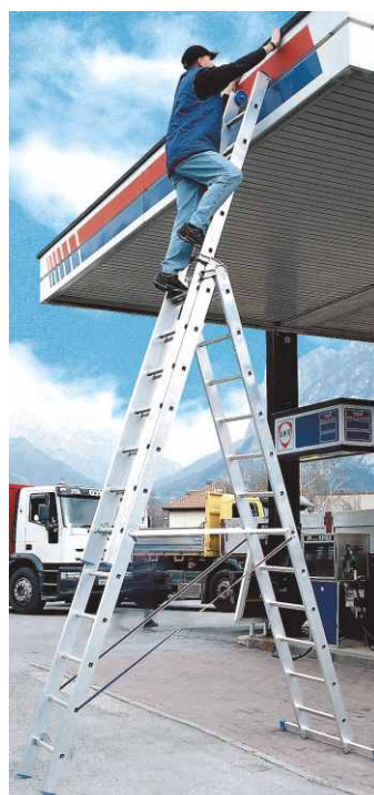
In foto articolo SCA 3047/12

Consentono il comodo scorrimento dell'ultimo tronco lungo la parete durante lo sfilo ed il ritorno dei tronchi