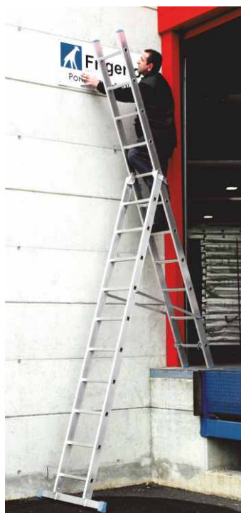
In foto articolo SCA 3045Z/11