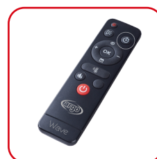
Telecomando a infrarossi Infrared remote control