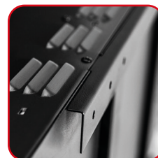
Supporti per appensione a parete forniti Brackets for wall mounting provided