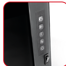
Pannello di controllo laterale Side control panel