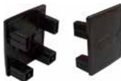
Tappo di chiusura per profilo Solar-fish AK SP