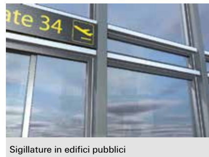
Sigillature in edifici pubblici