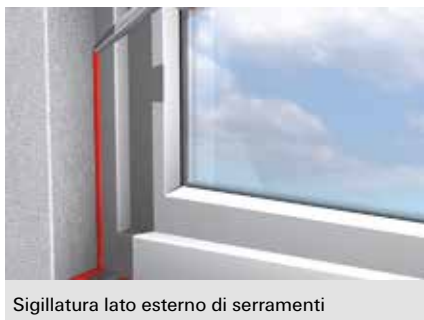
Sigillatura lato esterno di serramenti