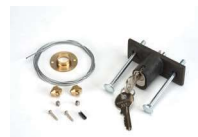
Sblocco esterno a chiave per porte con spessore oltre i 15 mm dal n.1 al n. 36