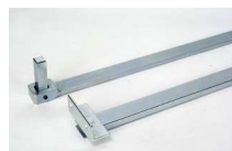
Braccio telescopico articolato con accessori per l'installazione