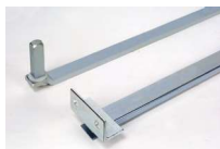
Braccio telescopico standard con accessori per l'installazione