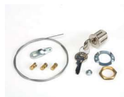
Sblocco esterno a chiave per porte con spessore max 15 mm (dal n. 1 al n. 36)